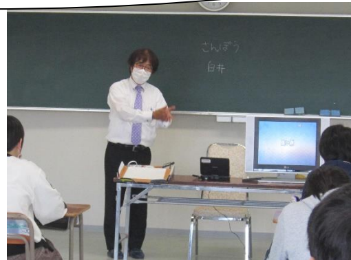
面接のポイントの講義中